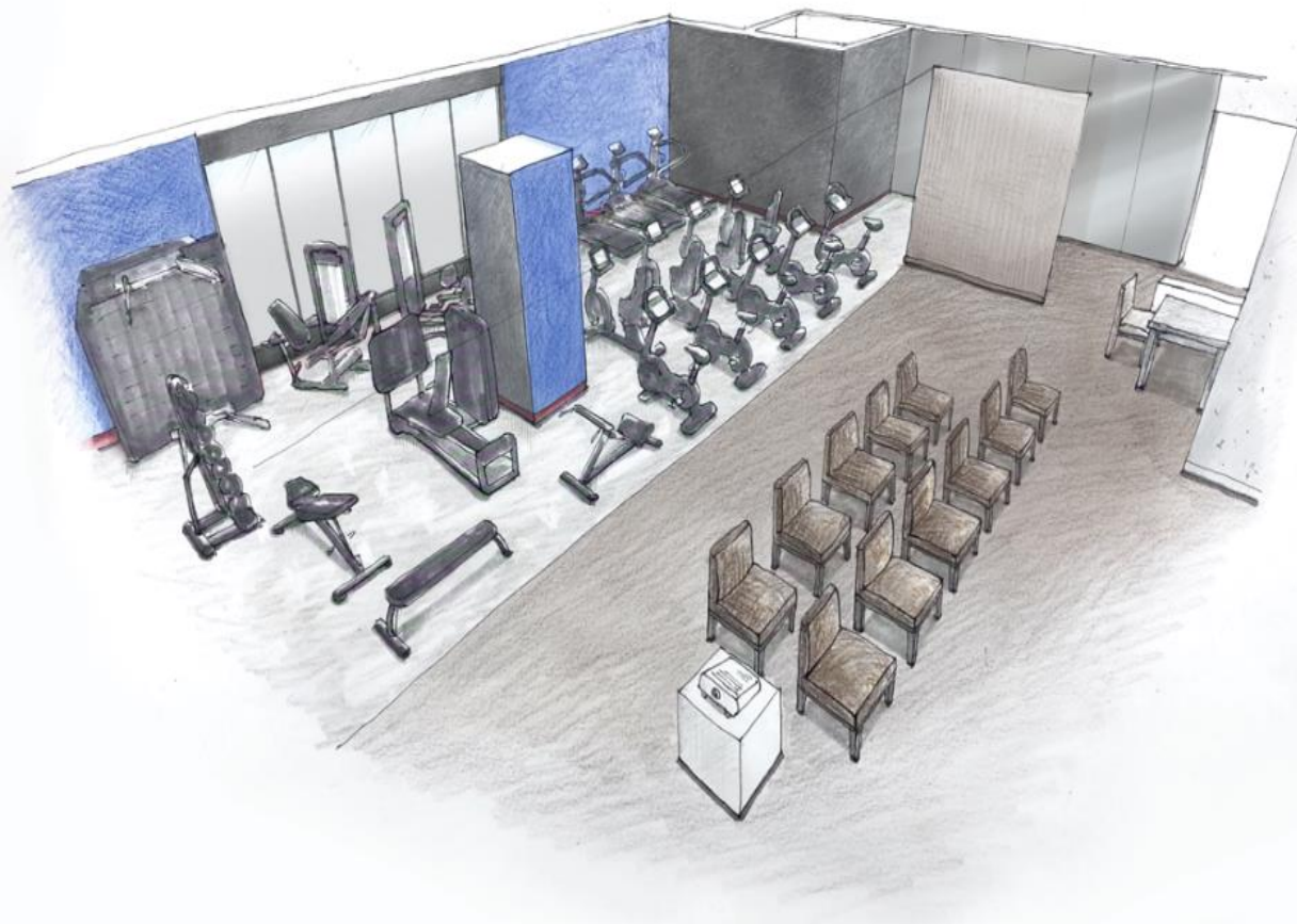
完成予想図 心臓リハビリテーション室