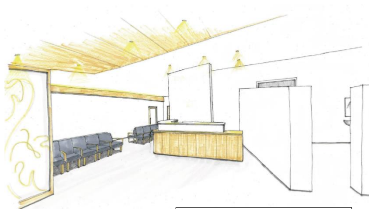
完成予想図 受付付近